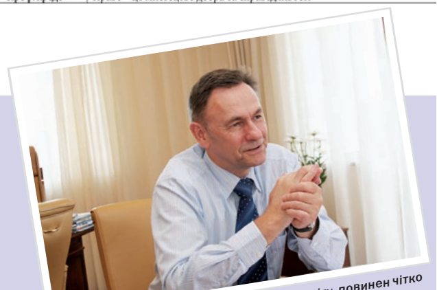
Фахівець, який здобув вищу юридичну освіту, повинен чітко з'ясувати, якими він володіє професійними якостями, і в якій сфері юридичної діяльності він ці якості може застосувати найкращим чином