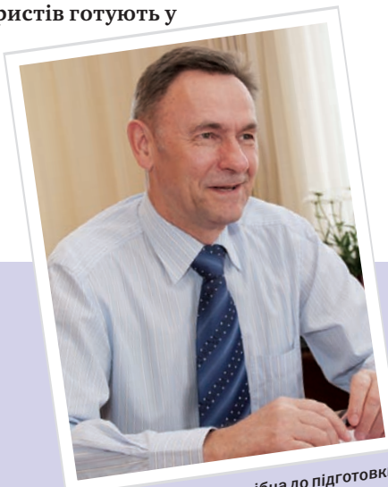
Підготовка юриста подібна до підготовки актора чи представника інших творчих професій. Вона не може здійснюватись без особистого контакту студента з носіями традиції

– Ви знаєте, останнім часом це питання справді набуло нової актуальності. Ринок зараз уже вимагає не просто дипломованого спеціаліста, а фахівця, який би мав певні моральні якості, що повинні бути притаманні певній професії. Це твердження поширюється на більшість категорій юристів, окрім працівників силових структур. Такі працівники