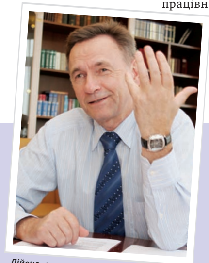
Дійсно, основа основ якісної підготовки юристів – це відбір абітурієнтів. Якщо ВНЗ ще на цій стадії відібрав студентів із відповідним потенціалом, здатних до навчання та здібних, то і випусники будуть належної якості