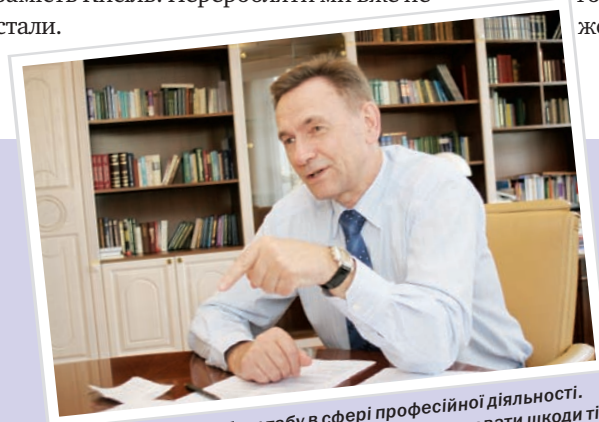
У юриста мають бути табу в сфері професійної діяльності. Наприклад, дії адвоката ніколи не повинні завдавати шкоди тій особі, якій він надає правову допомогу чи захист. В цьому і є суть його діяльності, навіть якщо клієнт адвоката виявився останнім негідником. Юрист також ніколи не повинен іти на порушення закону